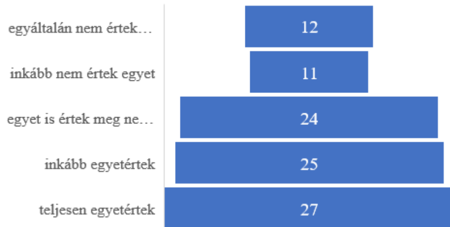
A háziállatok családtagnak tekinthetők.